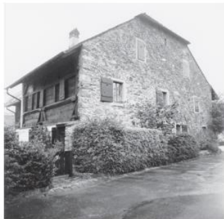
Haus Möcklistrasse 1, Witikon (BAZ)