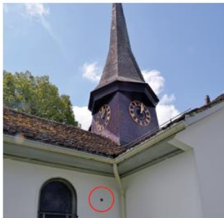
Alte Kirche Witikon

Zeugen der ersten Schlacht um Zürich sind noch heute die zwei in den Wänden der alten Kirche eingemauerten und die im Dachstock der Liegenschaft Eierbrecht 9 aufgefundenen Kanonenkugeln.