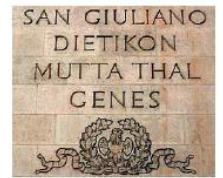
Inschrift am Arc de Triomphe Paris