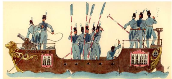
Kriegsschiff der Stadt Zürich Neptun

England war durch die Finanzierung der ab dem 20. August 1799 in Zürich stehenden russischen Armee von General Korsakow in Zürich vertreten. Der Gesandte Oberst William Wickham bemächtigte sich der Zürcher Seeflotte «allen voran des grossen Kriegsschiffs, um den Franzosen damit ziemlichen Schaden zuzufügen».